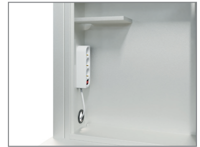
Medienschränk mit Mehrfachstecker und Ablage