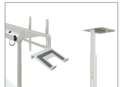
erweiterbar mit Laptop- / Kamera-Aufnahme